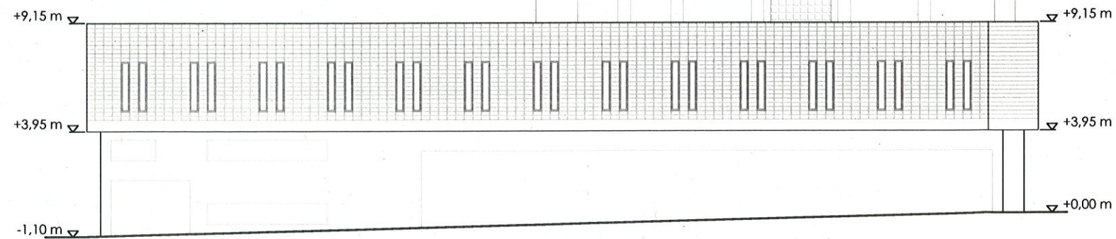
FAÇANA PRINCIPAL NORD-OEST Camí vell de la Colònia

Fulla exterior de bloc de formigó de 40x20x15 cm buit, pintat externament. Per l'interior, està plafonat o amb envà interior pintat. Les finestres són de 40x240cm i de fusta o alumini.